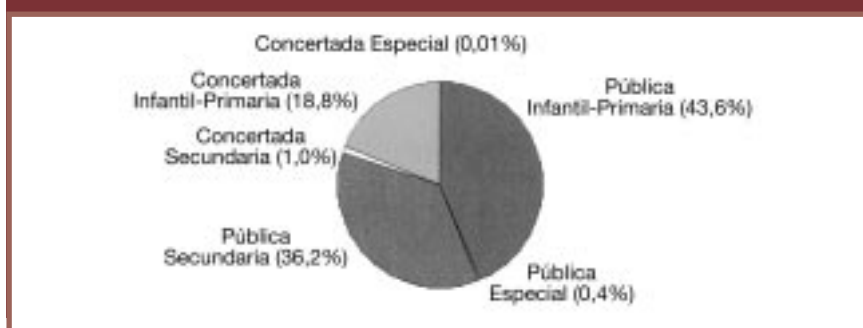
DISTRIBUCIÓN DEL CENSO ELECCIONES C.E.C.